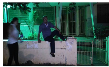
Olha eu a, em um dia que fui a uma festa de aniversário bem ao lado.

Nós, homens, no ato da matrícula, ganhávamos um bolso com a sigla GEAF para bordar e pregar na camisa de uniforme. E tinha que usar. E as mulheres, é claro, saia colegial. Era bonito o uniforme feminino. As camisas e blusas eram brancas e as calças e saias, azuis.