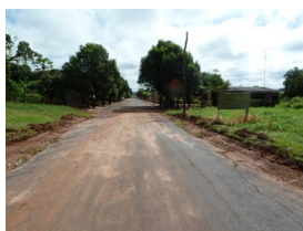
Entrada da vila

Dê-me um tempinho. Olha o que eu descobri na internet, fotos da entrada da vila por onde eu chegava, a igreja onde assistíamos a missa aos domingos. E a escola em que estudei até o 4º ano.